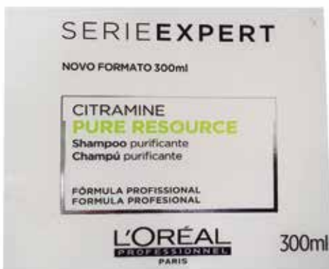
GRUPO C (Serigrafia)- SEGMENTO 1 – IMPRESSÃO SERIGRÁFICA - Categoria C.1.1 - Impressos em Geral - Rótulo Auto adesivo Shampoo Pure Resource - Makton