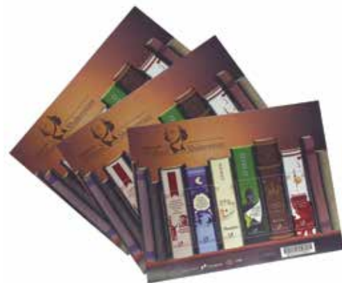
Grupo F (Offset) - SEGMENTO 1 – COMERCIAL - Categoria F.1.3 – Impressos de Segurança - Mini Folha com 6 selos Obras de William Shakespeare - Casa da Moeda do Brasil