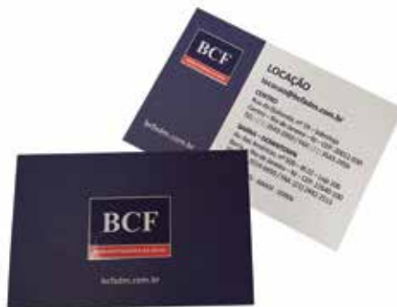
Grupo F (Offset) - SEGMENTO 1 – COMERCIAL - Categoria F.1.2 – Cartões de Visita - Cartão de Visita BCF - Onida