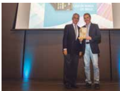
Casa da Moeda do Brasil