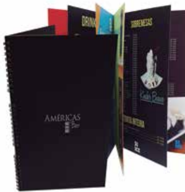
Grupo E (Digital) - SEGMENTO 1 – COMERCIAL - Categoria E.1.3 – Cardápios - Cardápio de Bebidas Américas Bar - Onida