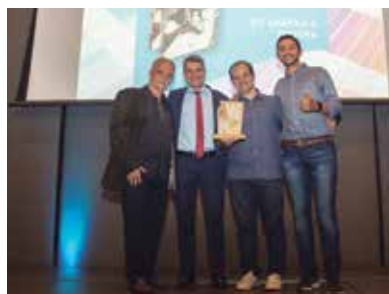
Zit Gráfica e Editora