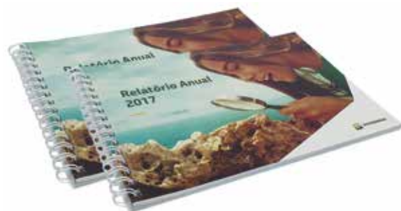
Grupo F (Offset) - SEGMENTO 6 – LIVROS - Categoria F.6.4 – Livros Técnicos e Institucionais - Relatório Anual 2017 - Petrobras - Aerographic