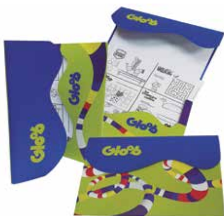
Grupo F (Offset) - SEGMENTO 1 – COMERCIAL - Categoria F.1.4 – Papelaria - Pasta Desenho Gloop - Holográfica