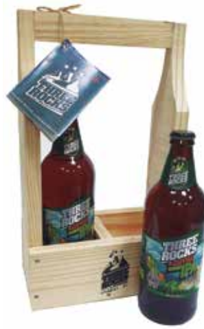
Grupo A (Especial) - SEGMENTO 1 – TRANSVERSAL - Categoria A.1.1 – Inovação e Tecnologia - Rótulo de Cerveja Three Rocks - Gráfica Editora Lima