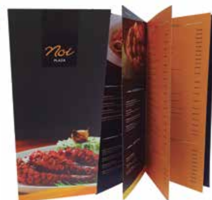
Grupo F (Offset) - SEGMENTO 1 – COMERCIAL - Categoria F.1.6 – Cardápios - Cardápio Noi Plaza - Power Print