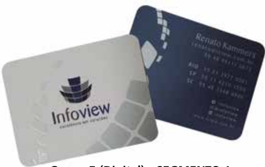
Grupo E (Digital) - SEGMENTO 1 – COMERCIAL - Categoria E.1.2 – Cartões de Visita - Cartões de Visita Infoview - DVZ