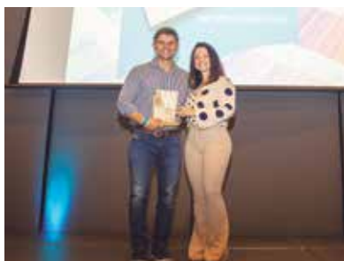
NB Nova Brasileira