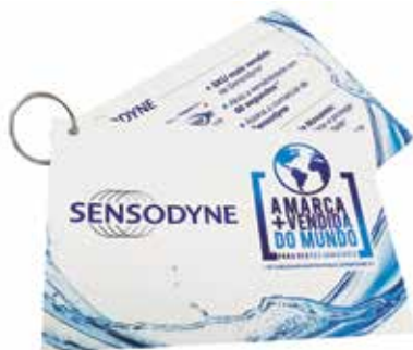
Grupo E (Digital) - SEGMENTO 3 – EMBALAGENS - Categoria E.3.2 – Rótulos, Etiquetas e Tags - Tag Sensodyne - DVZ