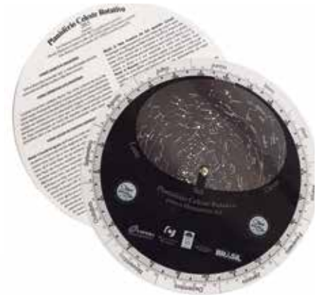
GRUPO D (Impressão Híbrida) - SEGMENTO 2 – PROMOCIONAL - Categoria D.2.1 – Promocionais em Geral - Planisfério Celeste Rotativo para o Hemisfério Sul - Gráfica Onida