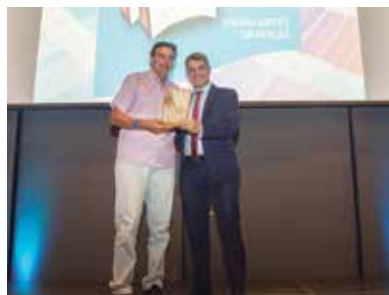
Swing Artes Gráficas