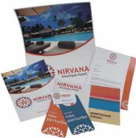
Grupo A (Especial) - SEGMENTO 1 – TRANSVERSAL - Categoria A.1.2 – Estudantil - Kit Nirvana Boutique Hotel - Ana Beatriz Gondim Sampaio