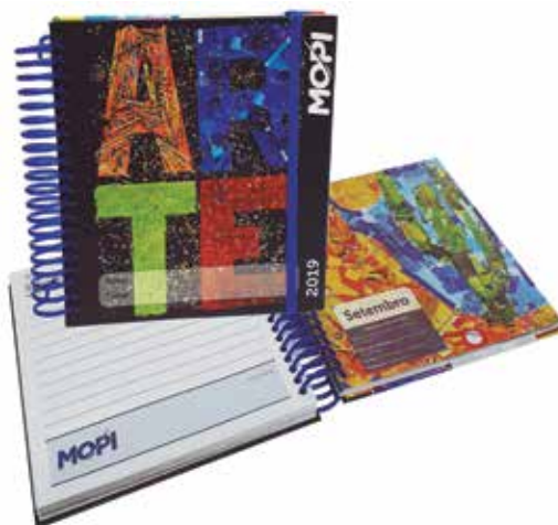
Grupo F (Offset) - SEGMENTO 1 – COMERCIAL - Categoria F.1.5 – Agendas - Agenda 2019 Colégio Mopi - DVZ