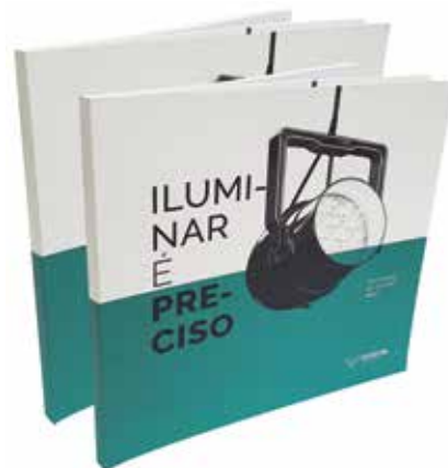
Grupo F (Offset) - SEGMENTO 6 – LIVROS - Categoria F.6.6 – Guias, Manuais e Anuários - Relatório Anual da Gestão Iluminar é Preciso - Aerographic