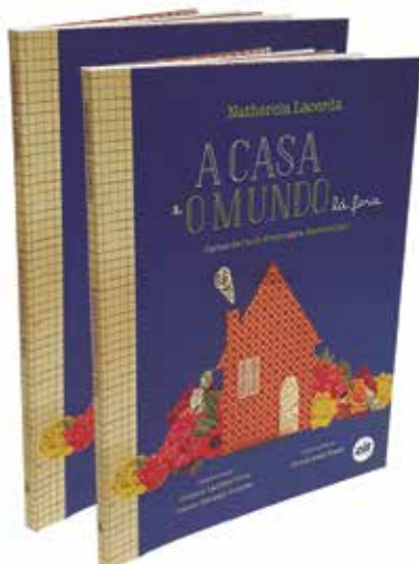
Grupo F (Offset) - SEGMENTO 6 – LIVROS - Categoria F.6.3 – Livros Infantis/Juvenis - A Casa e o Mundo lá Fora - Zit Gráfica e Editora