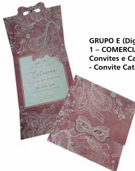
GRUPO E (Digital) - SEGMENTO 1 – COMERCIAL - Categoria E.1.1 – Convites e Cartões de Mensagem - Convite Catarina 15 anos - DVZ