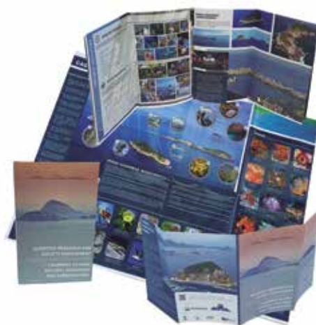
Grupo F (Offset) - SEGMENTO 2 – PROMOCIONAL - Categoria F.2.3 – Folhetos e Folders Publicitários - Folder Ilhas do Rio - Holográfica