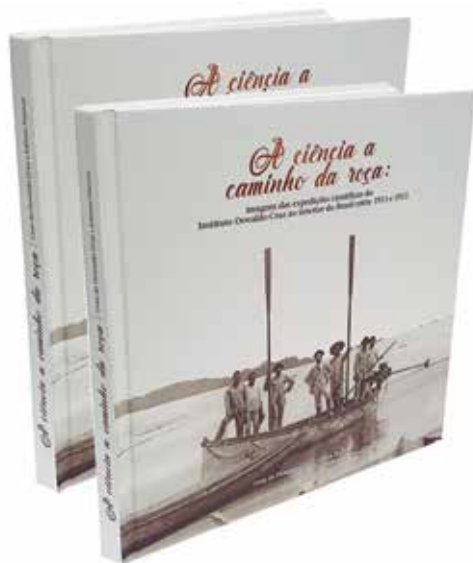
Grupo F (Offset) - SEGMENTO 6 – LIVROS - Categoria F.6.2 – Livros Culturais e de Arte - A Ciência a Caminho da Roça- Imos Gráfica