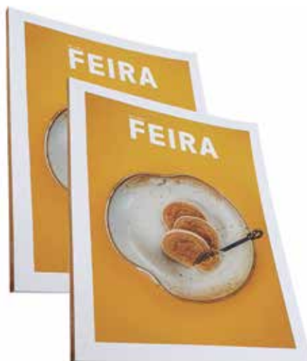
Grupo F (Offset) - SEGMENTO 5 – REVISTAS - Categoria F.5.1 – Revistas em Geral - Revista Feira - NB Nova Brasileira