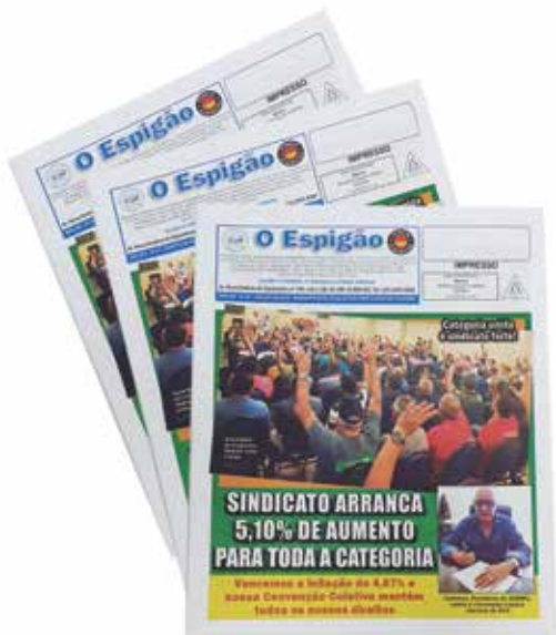
Grupo F (Offset) - SEGMENTO 4 – JORNAIS - Categoria F.4.2 – Jornais de Circulação Não Diária - Jornal O Espigão - Gráfica e Editora Rio DG