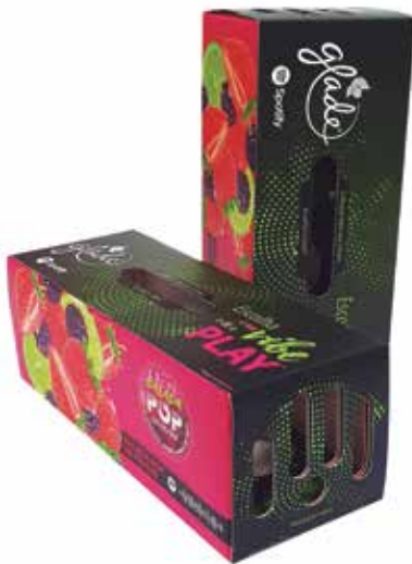
Grupo E (Digital) - SEGMENTO 2 – PROMOCIONAL - Categoria E.2.3 – Brindes - Caixa de Som Glade - DVZ