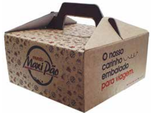
Grupo E (Digital) - SEGMENTO 3 – EMBALAGENS - Categoria E.3.1 – Embalagens em Geral - Caixa Torta Mundo Maxi Pão - Carton Wega