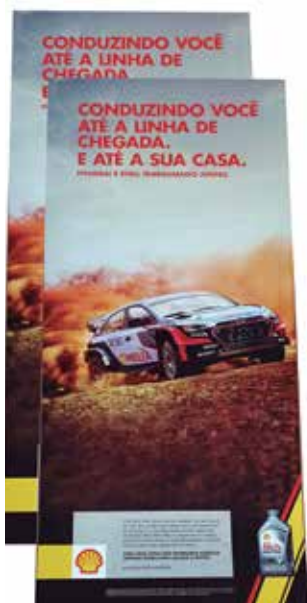
Grupo F (Offset) - SEGMENTO 2 – PROMOCIONAL - Categoria F.2.1– Poster, Banners e Cartazes - Cartaz Hyundai - Aerographic