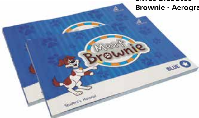
Grupo F (Offset) - SEGMENTO 6 – LIVROS - Categoria F.6.5– Livros Didáticos - Book Meet Brownie - Aerographic