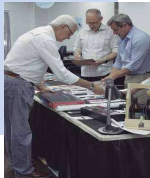
Os jurados em ação, na Escola Firjan SENAI SESI Maracanã