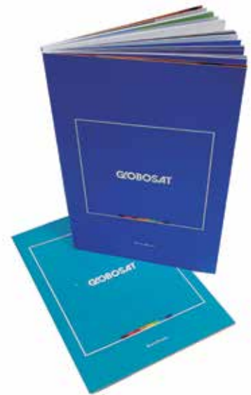
Grupo E (Digital) - SEGMENTO 2 – PROMOCIONAL - Categoria E.2.1 – Catálogos - Brand Book Globosat - DVZ