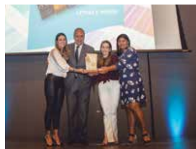
Letras e Versos