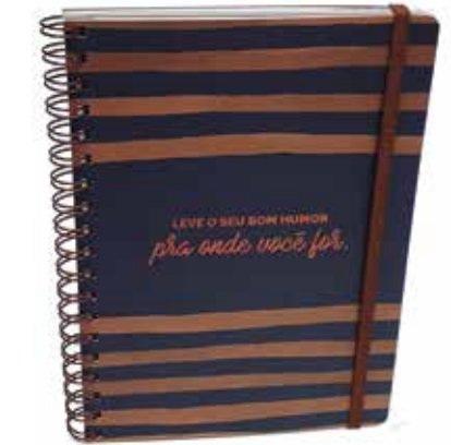
GRUPO B (Produtos Próprios) - SEGMENTO 1 – IMPRESSOS EM GERAL - Categoria B.1.2 – Impressos Promocionais em Geral - Caderno Marrom Listrado - Holográfica