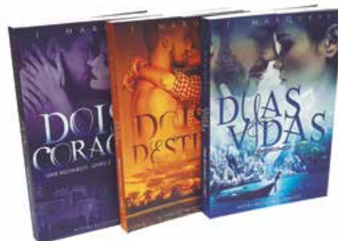
Grupo E (Digital) - SEGMENTO 5 – LIVROS - Categoria E.5.1 – Livros de Texto - Coleção Duas Vidas - Letras e Versos