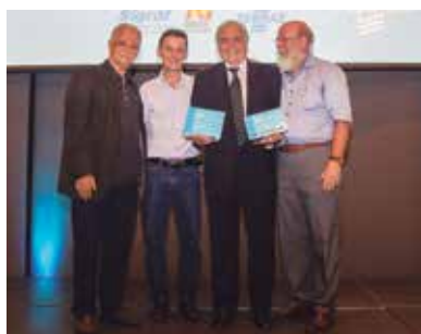
Ryobi e Horizon