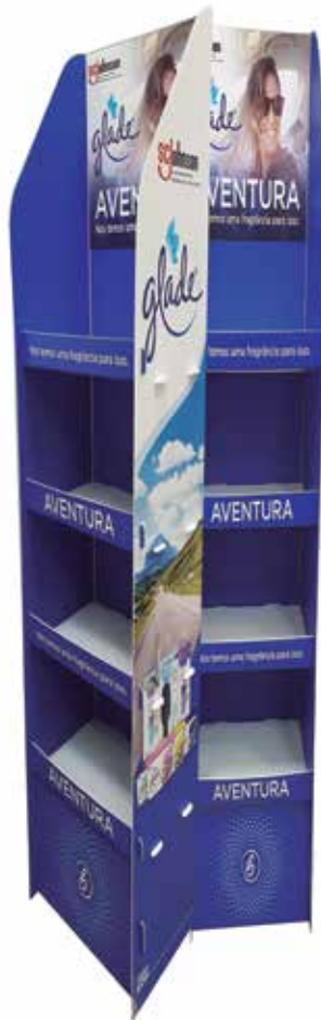
Grupo E (Digital) - SEGMENTO 2 – PROMOCIONAL - Categoria E.2.4 – Displays, Móviles, Banners e Comunicação Visual - Display de Chão Auto Air - Prosign