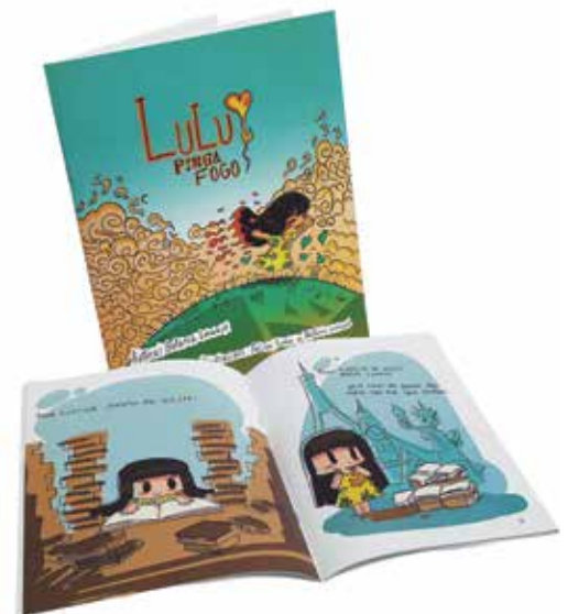
Grupo E (Digital) - SEGMENTO 5 – LIVROS - Categoria E.5.2 – Livros Ilustrados - Livro Lulu Pinga Fogo - Letras e Versos