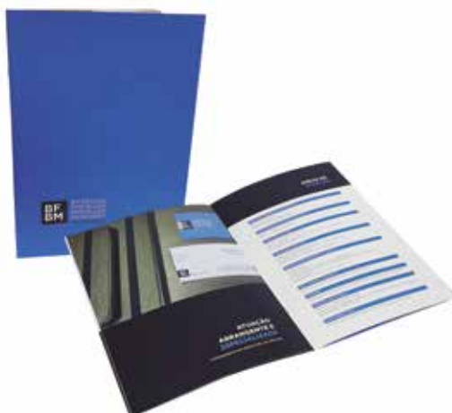
Grupo F (Offset) - SEGMENTO 2 – PROMOCIONAL - Categoria F.2.2 – Catálogos - Catálogo Advogados BFBM -Holográfica