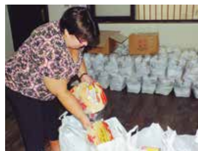
Distribuição de cestas básicas