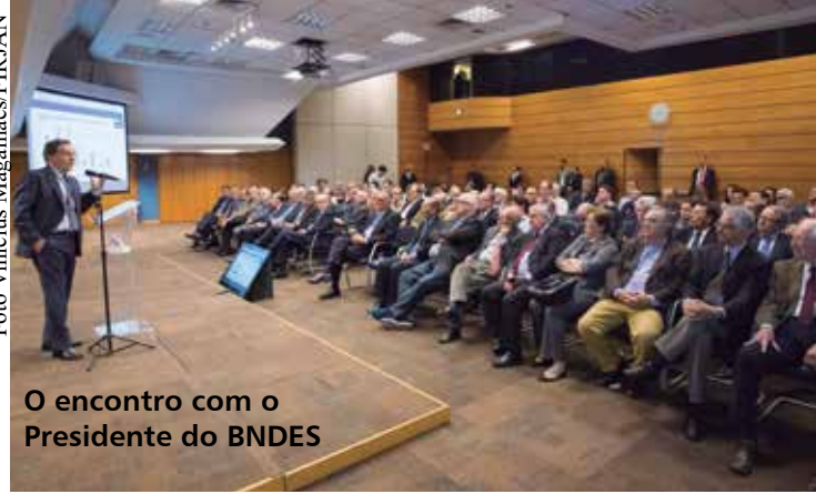
O encontro com o Presidente do BNDES